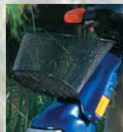
Panier - avant ou arrière