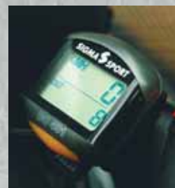
Compteur kilométrique/ indicateur de vitesse