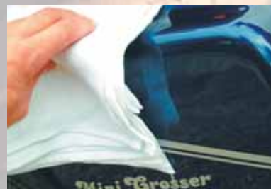
Facile à nettoyer