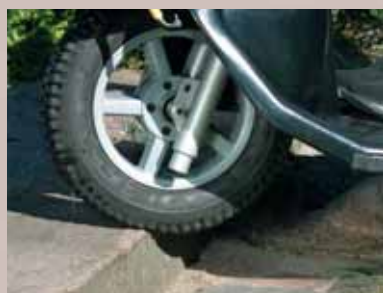
Monte facilement les trottoirs

Si vous voulez du confort, de l'endurance, du design et du prestige, le Mini Crosser est le meilleur investissement.