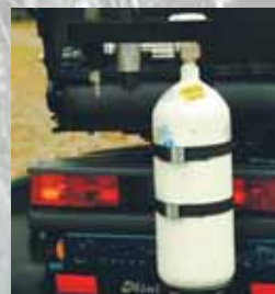
Porte bouteille d'oxygène