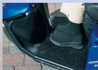
De l'espace pour les jambes aussi bien en trois roues qu'en quatre roues